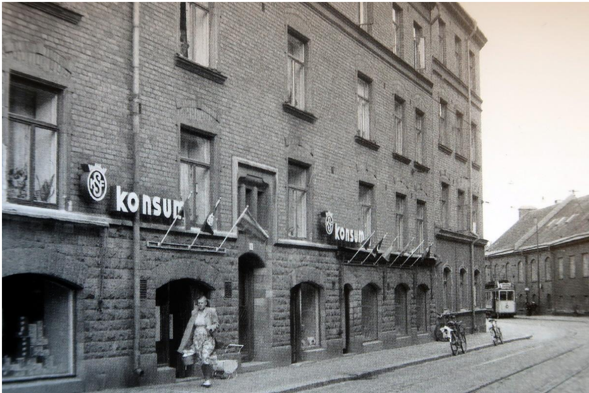
Danviksgatan vid stearinfabriken ...